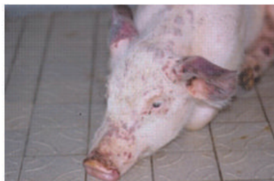
Rougeurs cutanées