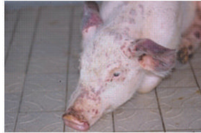
Roodheid van de huid